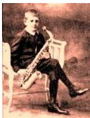
Marcel Mule à 8 ans

" La voix du saxophone [...] tient le milieu entre la voix des instruments en cuivre et celle des instruments en bois; elle participe aussi [...] de la sonorité des instruments à archet. Son principal mérite [...] est dans la beauté variée de son accent, tantôt grave et calme, tantôt passionné, rêveur ou mélancolique [...] Aucun autre instrument de musique existant, à moi connu, ne possède cette [...] sonorité [...]"