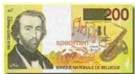
Adolphe Sax (sur un billet de 200 francs belges)