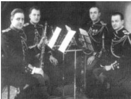
le quatuor Marcel Mule