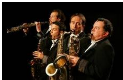
le quatuor des Désaxés